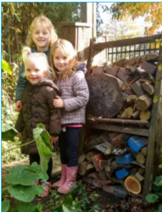
Deze kinderen hebben het insectenhotel opgeknapt.

Nieuwsgierig geworden? Kom langs op dinsdagavond (behalve als het regent) of op een zaterdagochtend en help een handje mee om dit paradijs nog mooier te maken (en wie weet gaat u naar huis met een stekkie van....)