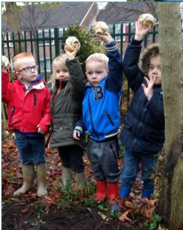
Wat een joekels van bollen!