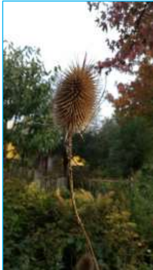
Deze distel zit vol met honderden zadjes tussen de stekels.