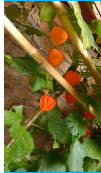
De lampionplant verstoppt zijn zadjes in een aantrekkelijke vrucht.